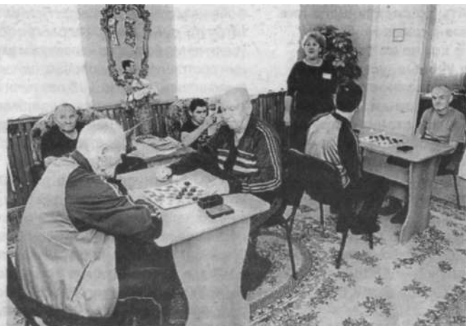
Здесь проводят свободное время любители шахмат и чтения