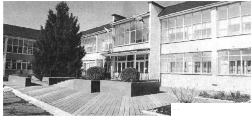
Здание "Гомеровского психоневрологического интерната"

- Чувствует ли Маша, хорошо или плохо к ней относятся?