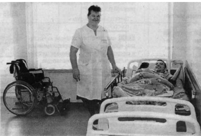
В отделении милосердия живут лежачие больные