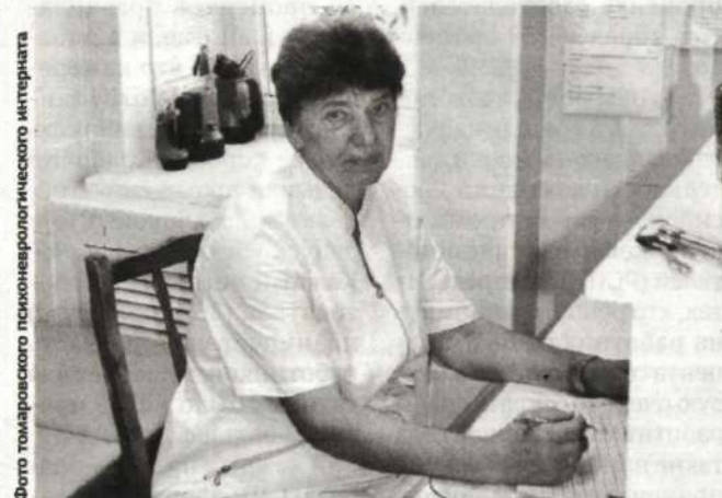
Фото томаровского психоневрологического интерната

Верится, что и впредь де- ятельность этих сотрудни- ков будут отличать высокий профессионализм, чуткость и сострадание.